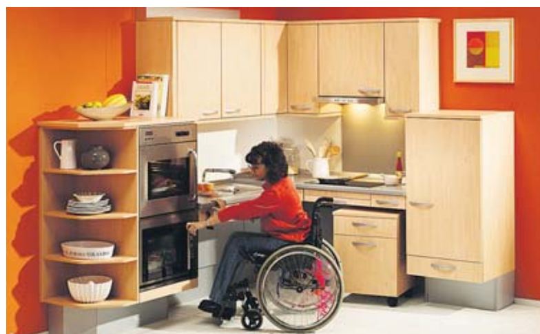
Hilfreich ist es, wenn alle technischen Geräte wie Herd, Ofen oder Geschirrspüler in Augenhöhe installiert werden.

„Barrierefrei Leben“ berät unter www.online-wohn-beratung.de. Weitere Infos zu Fördermitteln unter www.nullbarriere.de